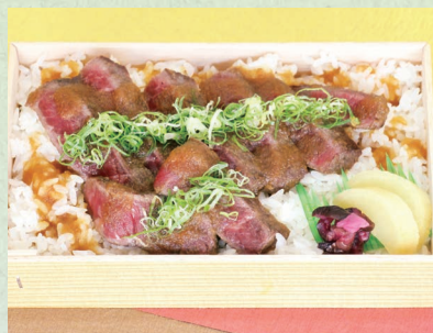
和牛ステーキ丼 1,404円