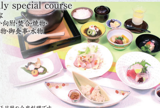
※写真はお正月用の会席料理です。