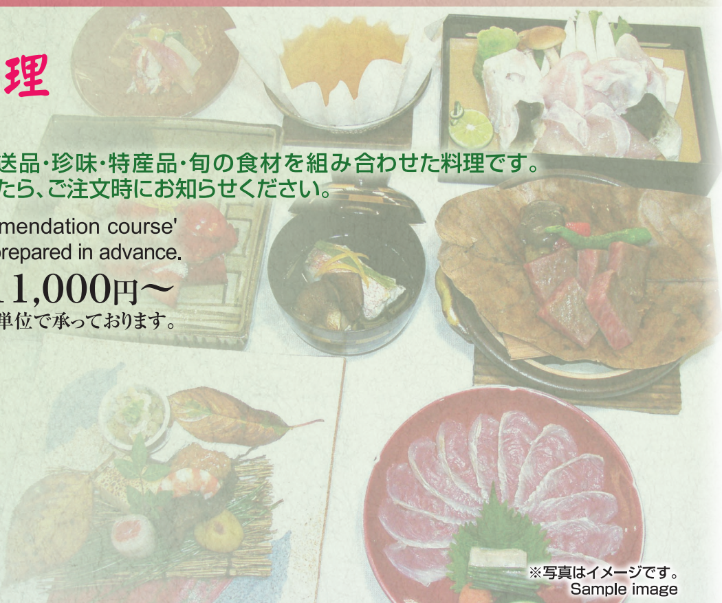
※写真はイメージです。 Sample image