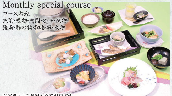
※写真はお正月用の会席料理です。