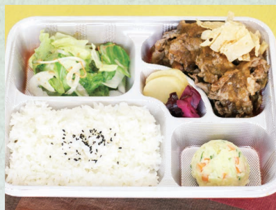
和牛レモンソース弁当 1,080円