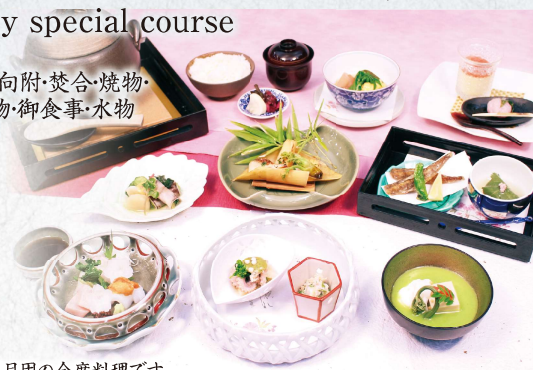
※写真はお正月用の会席料理です。