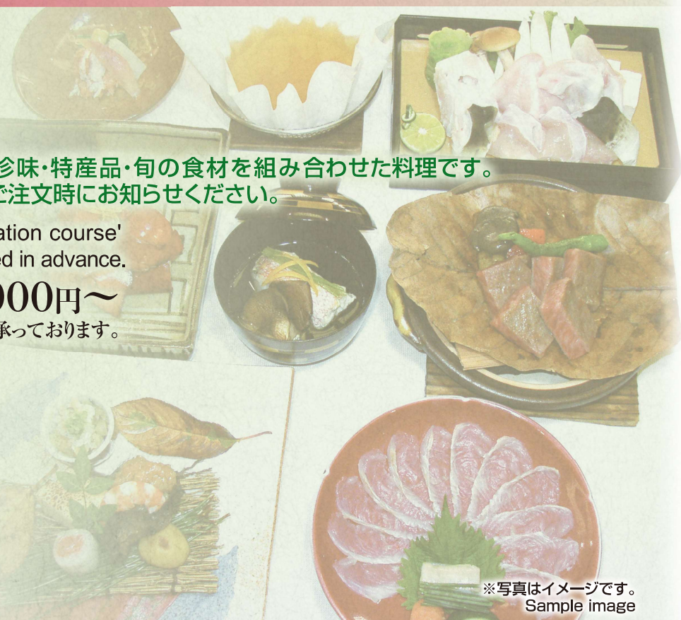
※写真はイメージです。 Sample image