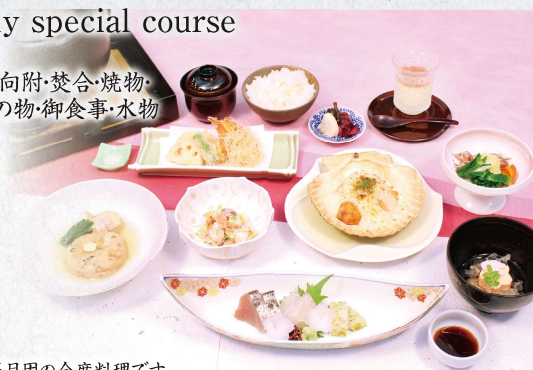
※写真はお正月用の会席料理です。