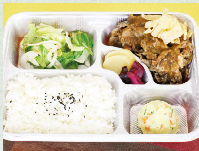
和牛レモンソース弁当 1,080円