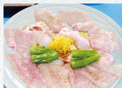
ふぐタレ焼き Grilled fugu with sweet soy sauce.