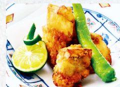
ふぐ唐揚げ Deep fried fugu.