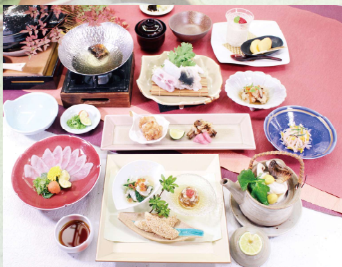
写真はイメージです。 Sample image