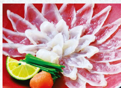
てっさ Fugu sashimi.