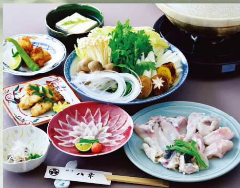
写真はイメージです。 Sample image