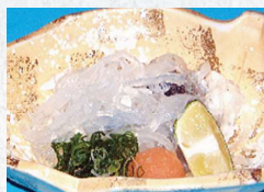
ふぐ皮湯引き Fugu slightly soaked in boiling water.