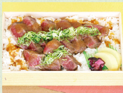
和牛ステーキ丼 1,404円