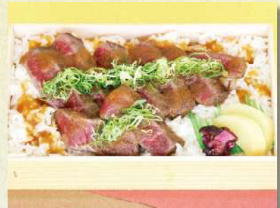
和牛ステーキ丼 1,404円