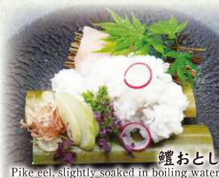
鰻おとし Pike eel, slightly soaked in boiling water.

表示は消費税10%を含みます。別途サービス料として10%を頂戴いたします。 The price includes the consumption tax(10%). Separately the 10% service charge.