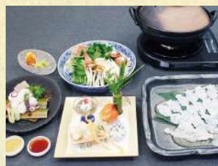
写真の鍋は2人前です。