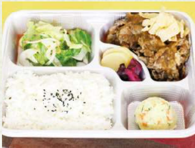
和牛レモンソース弁当 1,080円