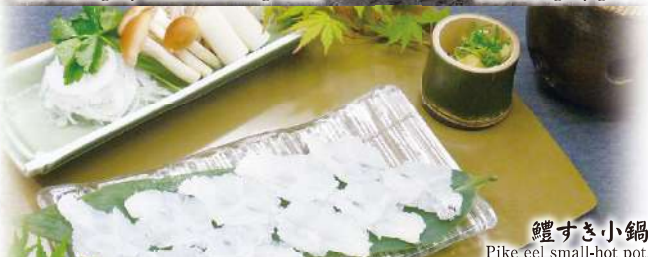
鰻すき小鍋 Pike eel small-hot pot.