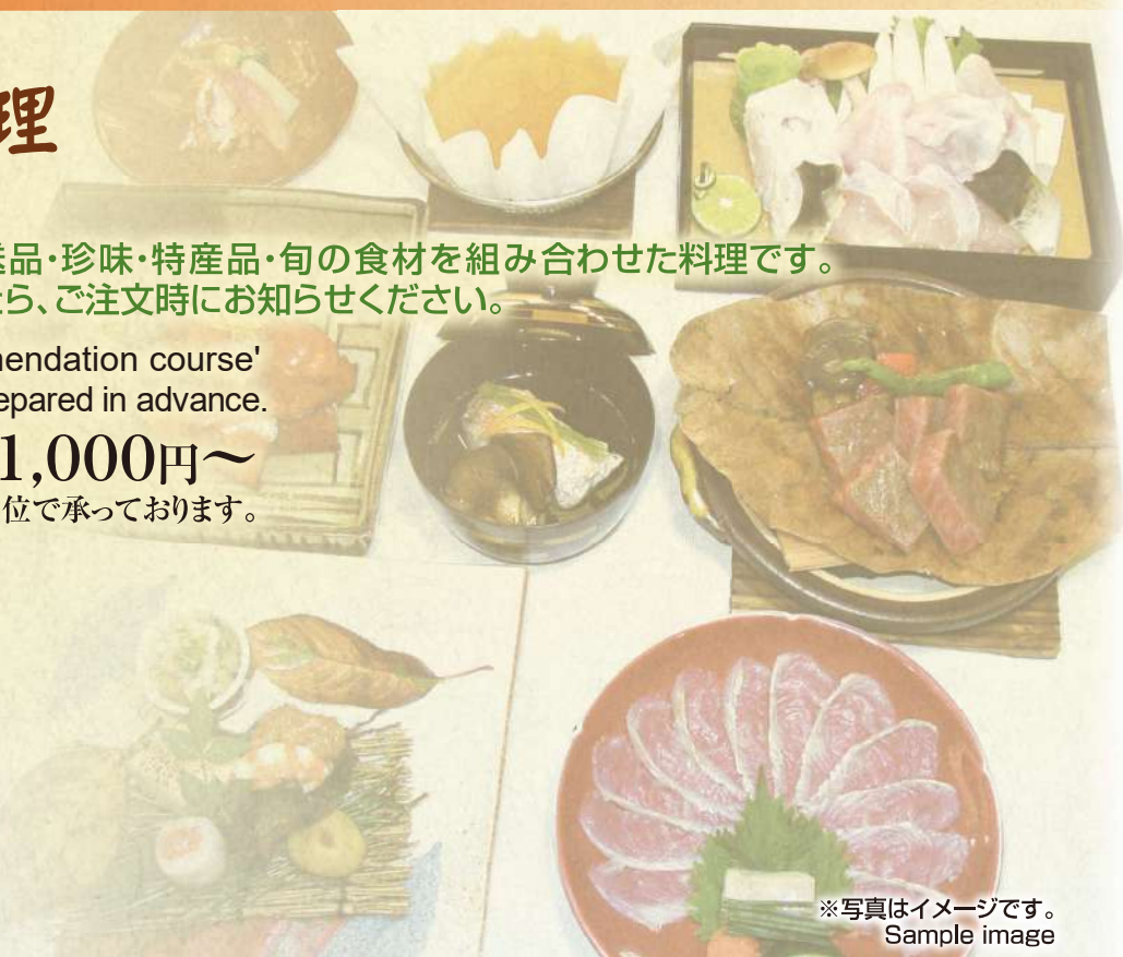
※写真はイメージです。 Sample image