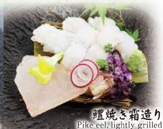
鰻焼き霜造り Pike eel, lightly grilled.