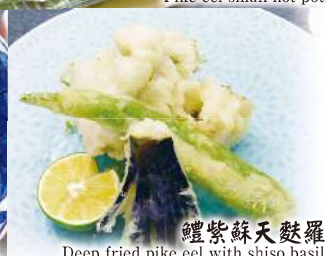
鰻紫蘇天麩羅 Deep fried pike eel with shiso basil.