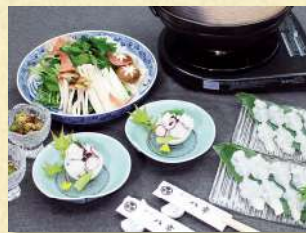
写真の鍋は2人前です。